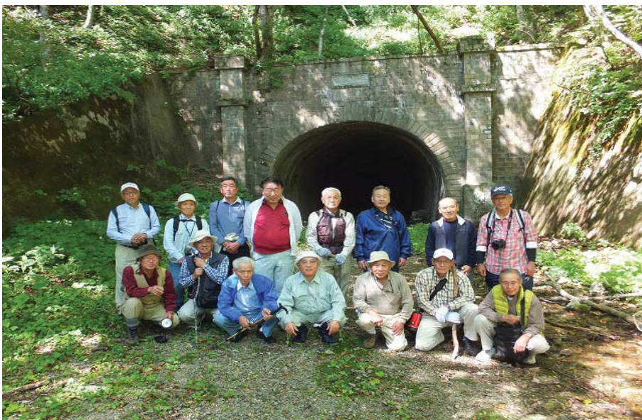
【群馬県高崎市有志万世大路探訪会一行 ・ニツ小屋隧道福島側坑口にて】