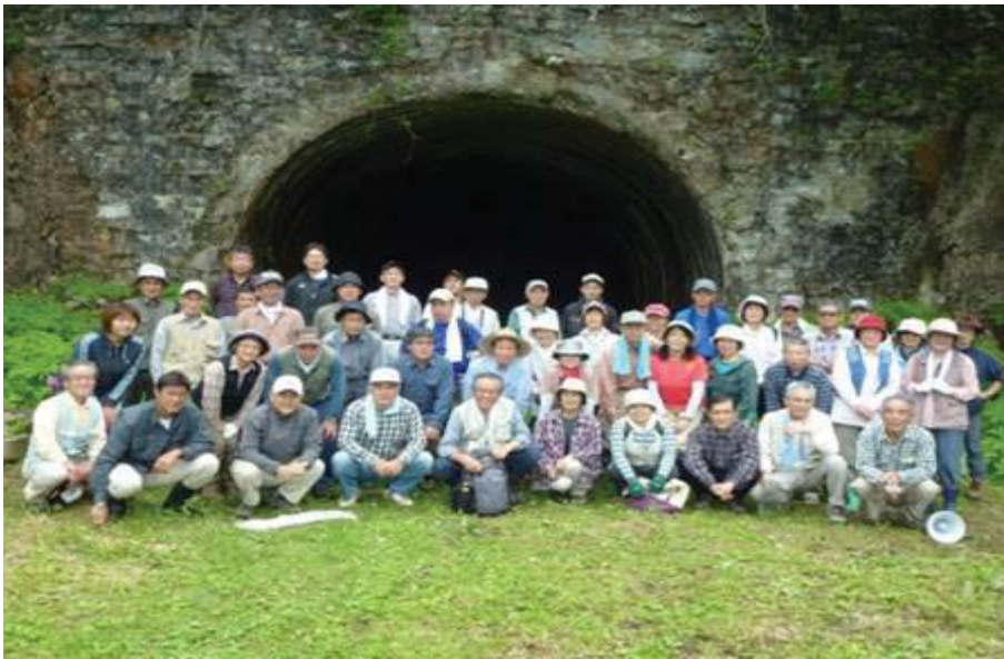
【万世大路散策事業(一般)】