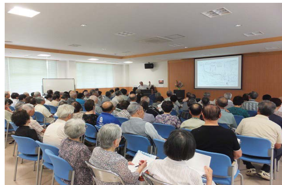
【「もちざりことぶき大学」もちざり学習センター】