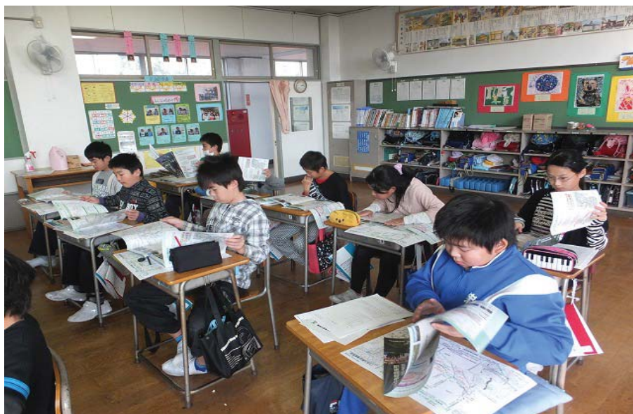
【福島市立中野小学校 総合学習、(万世大路について)】