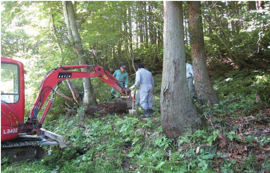
【高速道路の建設会社 ボランティアで看板設置】