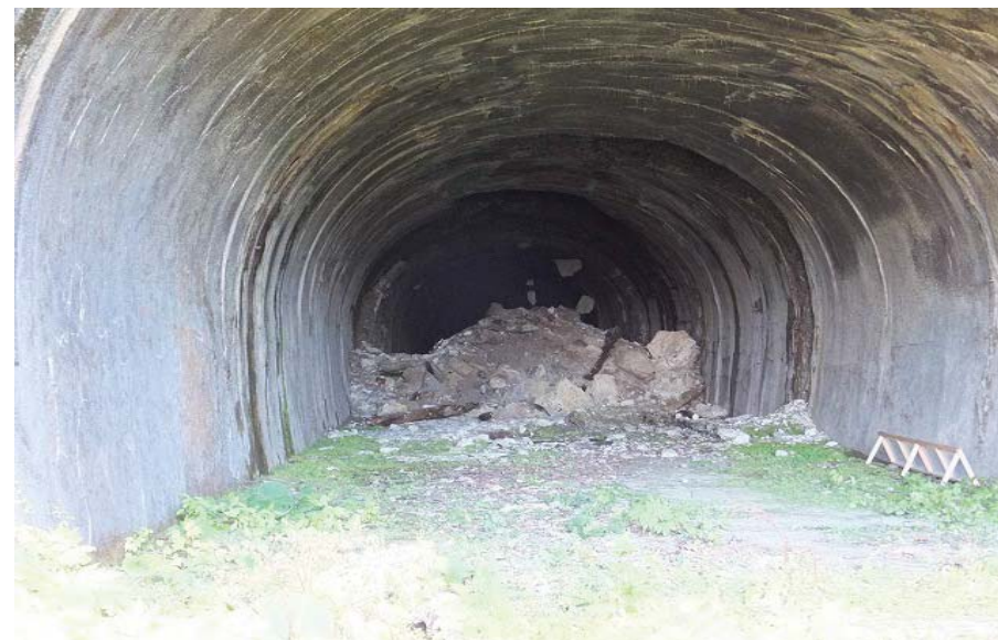
【栗子隧道崩落状況米沢側坑口】