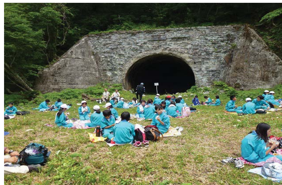
【万世大路学習事業栗子隧道 保存会】