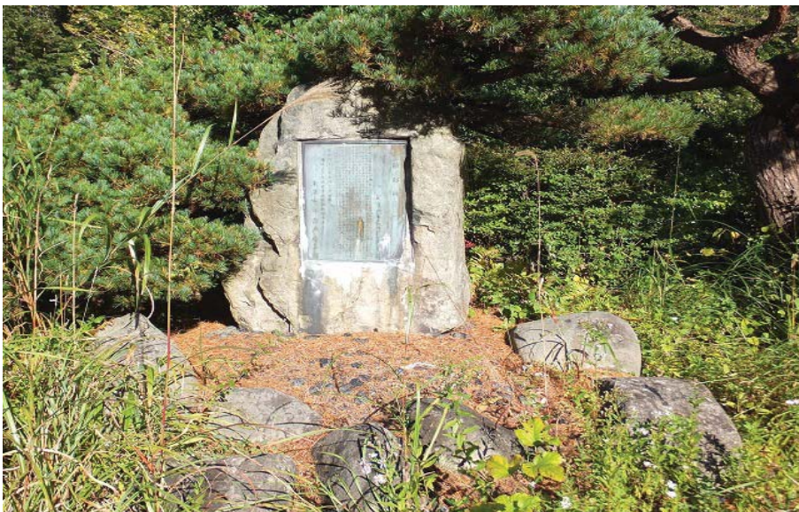
【星忠榮氏顕彰碑 元糠野目村長、 国道13号線改良促進期成同盟会事務局長】