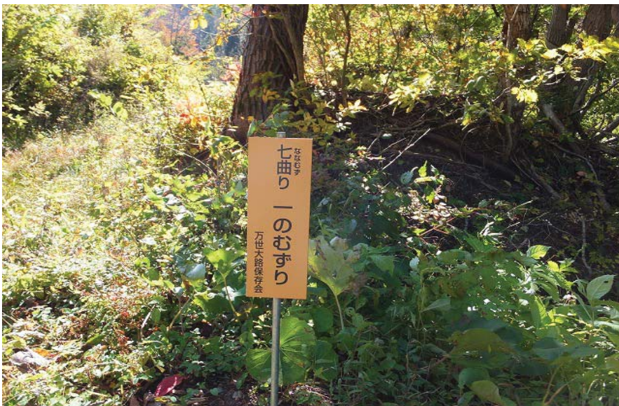
【案内板 万世大路山形県側 万世大路保存会】