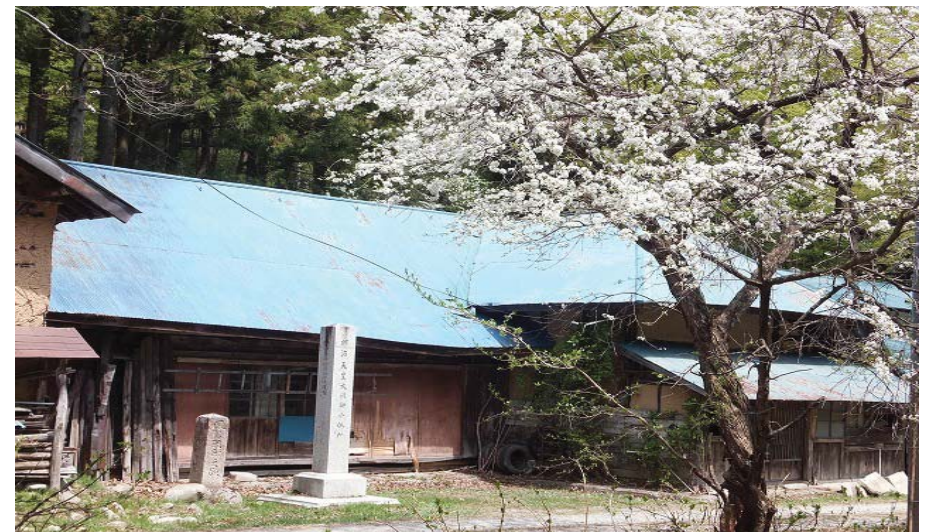
【明治天皇御巡幸明治14年10月3日 大滝御小休所 (中屋旅館、渡辺要七宅)昭和10年11月史蹟指定。 石碑:「鳳駕駐蹕之蹟(明治41年9月12日建立)】