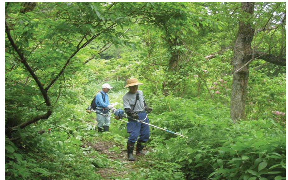
【旧道除草 保存会会員による】 20