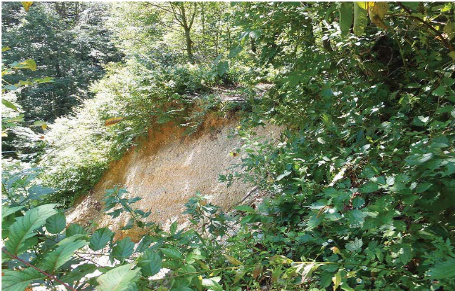
【烏川橋先(米沢側)へアピンカーブ箇所の崩落進む。 米沢側から福島側を望む。写真上が旧万世大路】 17