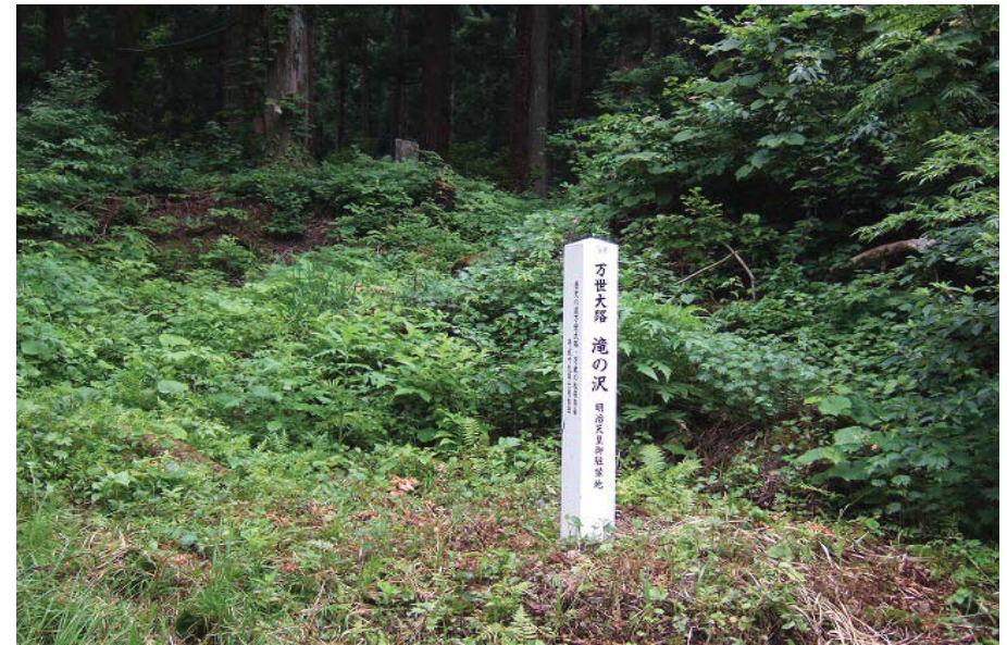
【案内標柱滝の沢、明治天皇御駐輦地】