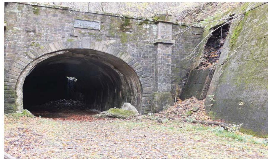
【ニツ小屋隧道米沢側破損状況。 奥明巻部覆工コンクリート崩落・ 内巻コンクリート剥落・袖擁壁崩落。】