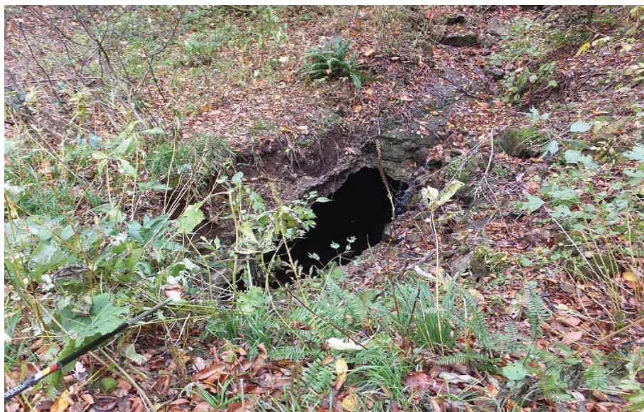
【ニツ小屋隧道覆工コンクリート崩落箇所、地表左側から望む】